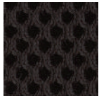
MMC - Exact

CHOIX DE MAILLE POUR LES DOSSIERS (Veuillez consulter la carte de recouvrements Expression.)