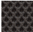
MME - Elegance