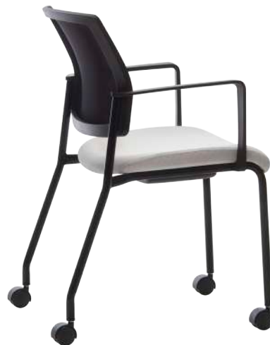
FT32C Quadrille QA02 Cabaret