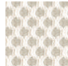
MMP - Perfection