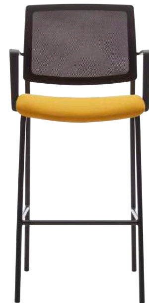
FT32H Quadrille QA07 Zest