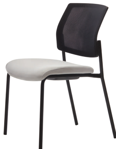
FT31 Quadrille QA02 Cabaret