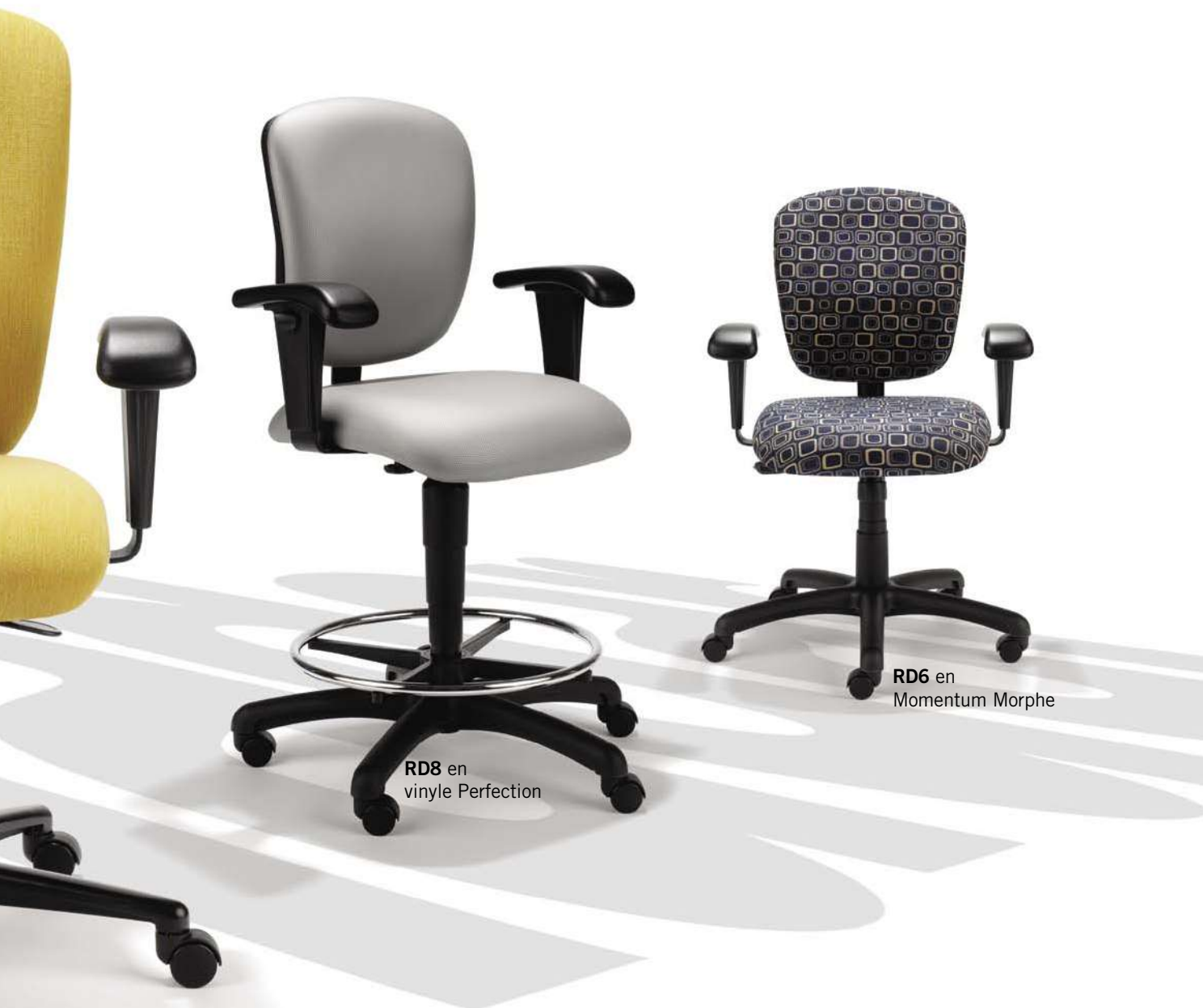
RD8 en vinyle Perfection

Les chaises Radar ont une structure de soutien fiable et assureront votre confort pendant de nombreuses années.