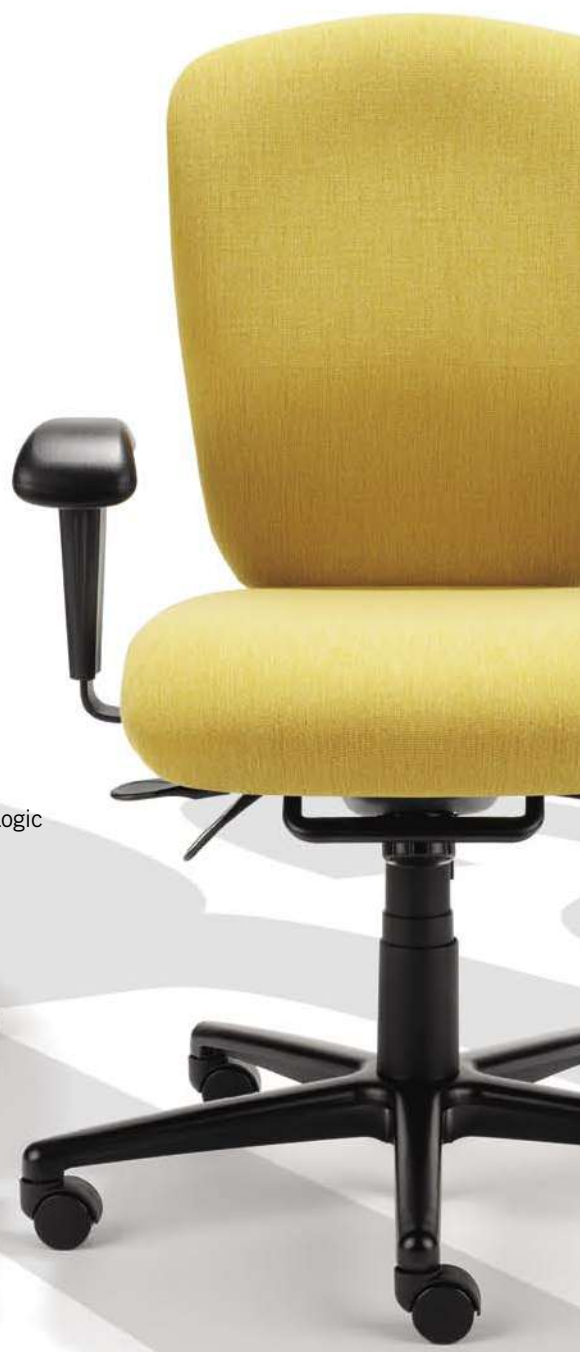
RD16 en Momentum Logic