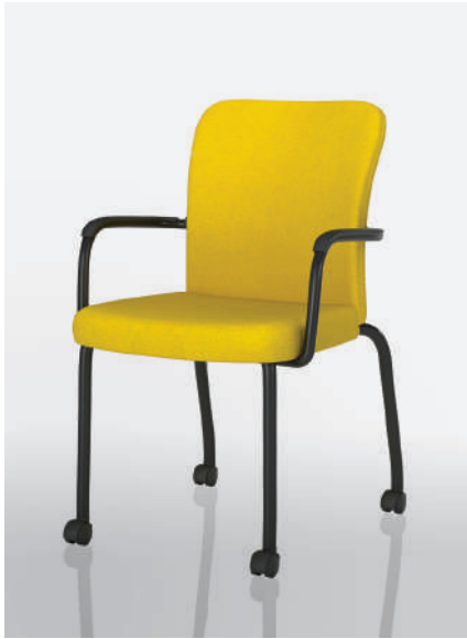
ON34C-DP - Maharam MG054 Lumine