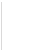
ONWH - Blanc