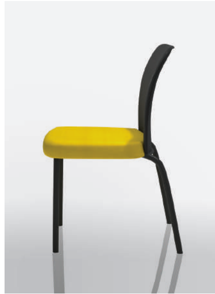
ON31-DP - Maharam MG054 Lumine & dossier en polypropylène ONBK