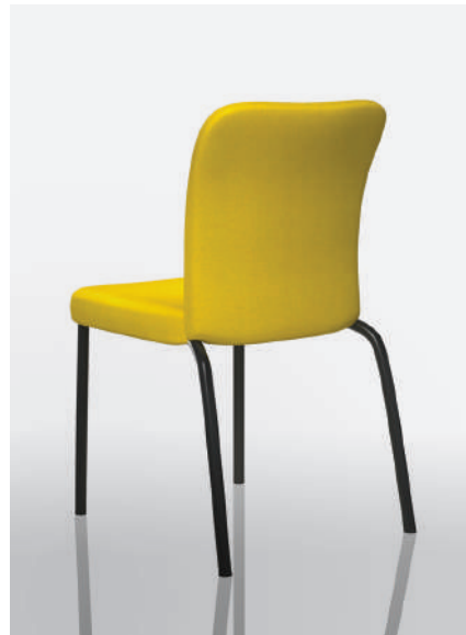
ON33-DP - Maharam MG054 Lumine

Les chaises visiteur Onyx mc sont disponibles avec une coquille de dossier en polypropylène offerte dans un choix de trois couleurs. Et que vous les préfériez sur roulettes ou sur des patins, avec bras ou sans bras, les chaises Onyx mc sont prêtes à rencontrer toutes vos exigences.