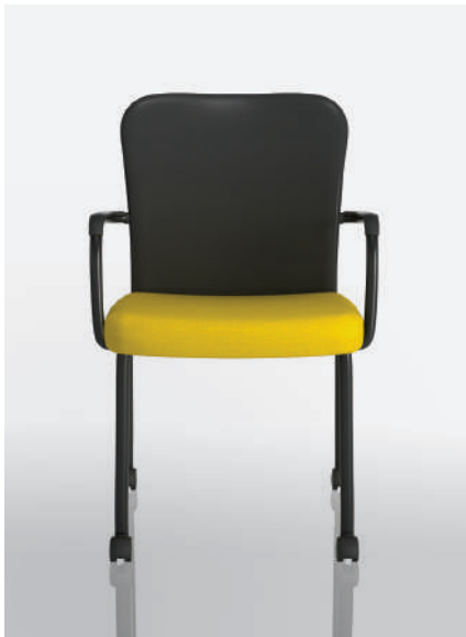
ON32C-DP - Maharam MG054 Lumine & dossier en polypropylène ONBK