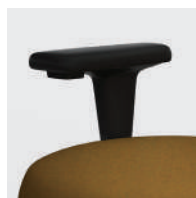
Bras RPA - Bras optionnels réglables en hauteur et en largeur avec appui-bras pivotants.