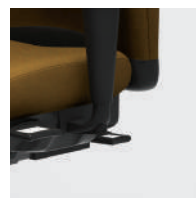
SSP - Mécanisme de siège à glissière.

Les produits United Chair® sont certifiés GREENGUARD® Qualité de l'air des locaux certifiés et Enfants et écoles. Les produits United Chair® sont conformes aux normes ANSI/BIFMA X5.1-2002 et ISO 14001:1996. Les renseignements qui figurent au présent document peuvent être changés sans préavis.