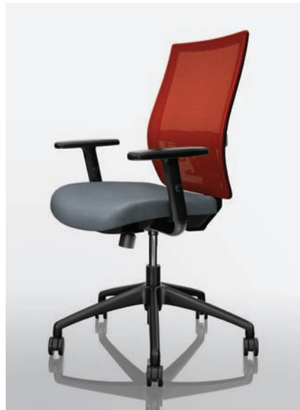
VC13 - Maharam MG031 Cloud

Affinity propose un soutien et une fonction ergonomiques supérieurs dans une conception sans égal.