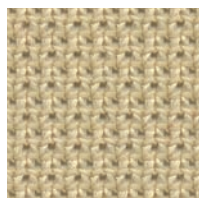
MVY - Yellowstone