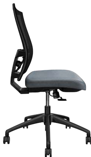
VC12 Maharam MG031 Cloud