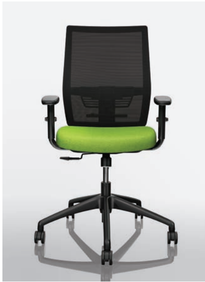
VC13 - Maharam MG048 Neon