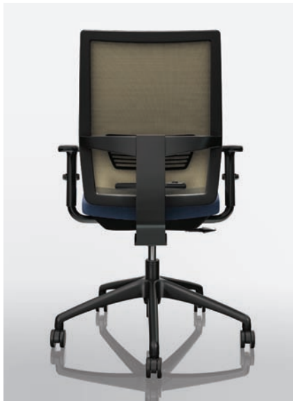
VC13 - Aella AE08 Nightsky