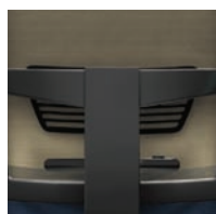
Support lombaire standard réglable en hauteur