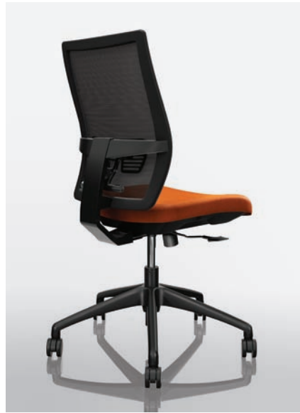
VC12 - Maharam ML061 Tiger Lily