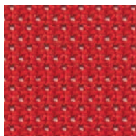
MVM - Magma