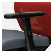
Bras réglables en hauteur optionnels