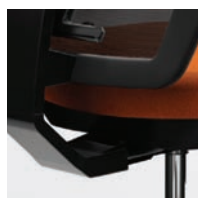
Mécanisme de siège à glissière standard